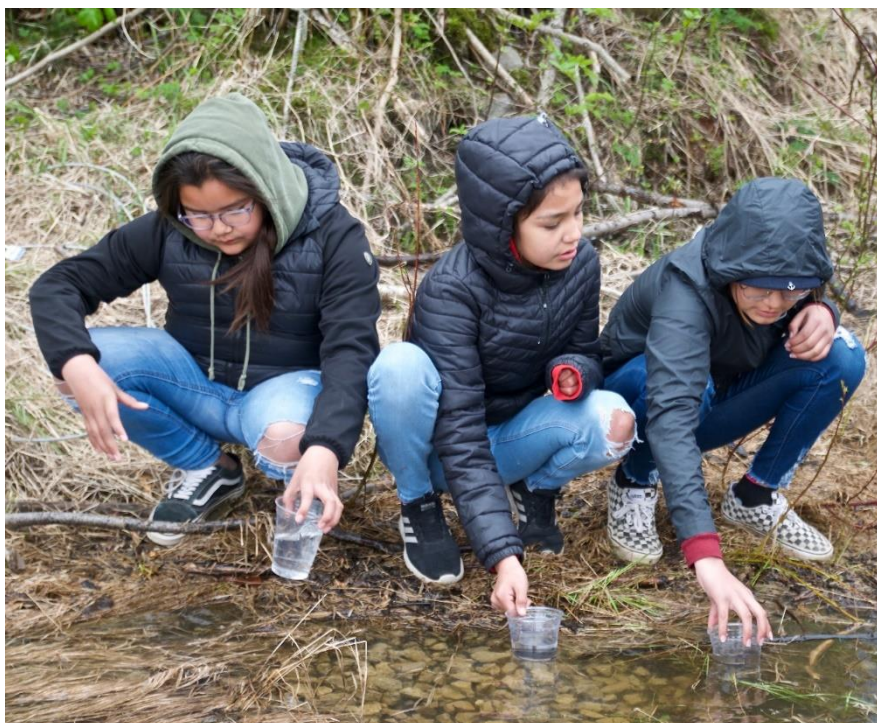
Des enfants de Mingan lors de l'activité d'ensemencement.

En 2019, l'unique activité du volet Ensemencement est la subvention allouée dans le cadre du programme éducatif « Histoire de saumon », à la hauteur de 3 000 $. Le PDPS a permis à plusieurs écoles d'acquérir le matériel nécessaire afin de sensibiliser les enfants au cycle de vie du saumon et les enjeux de conservation par le biais de systèmes permettant de faire éclore des œufs et, ainsi, de suivre le cycle de vie des saumons. Les élèves voient leurs œufs évoluer jusqu'au stade d'alevin. Par la suite, ils les ensèment généralement dans la rivière à saumon la plus près de leur établissement scolaire.