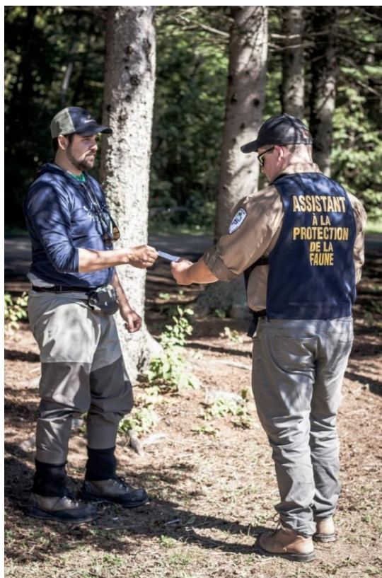
Protection sur la rivière Matane.