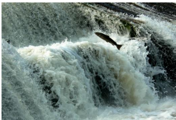
Un saumon qui remonte la passe de la Rivière-à-Mars.

Opérations de décompte est une subvention qui consiste à couvrir les actions récurrentes d'entretien et d'achat du matériel qui sert à assurer un suivi des montaisons de saumon ainsi que le temps d'opération pour le décompte en apnée. Sensiblement similaire d'une année à l'autre, ce sous-volet de décompte prévoit un montant de 175 000 $ pour les opérations récurrentes liées au suivi des montaisons de saumon sur les rivières du Québec. Les organismes qui déposent leurs projets de décompte sont subventionnés à environ 80 % de leurs dépenses admissibles. Chaque année depuis le début du programme, le cumulatif des demandes de subvention honore les montants prévisionnels. En 2019-2020, un montant de 155 284 $ a été accordé, et le montant résiduel sera reporté à l'année 2020-2021.