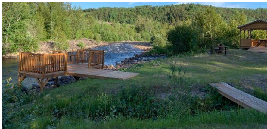
Plateforme d'accès à la fosse pour personnes à mobilité réduite. Rivière-à-Mars

Certains projets, comme celui des plateformes d'accès à certaines fosses pour les personnes à mobilité réduite de la Rivière-à-Mars, sortent du lot. Ce projet ingénieux permet d'organiser des événements et des campagnes de financement avec des organismes caritatifs et améliore l'accès pour tous à la pêche sportive au saumon atlantique.